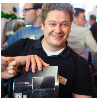
Bild 5: Später am Abend: glücklicher Gewinner der Nintendo Spielekonsole 3DS und dem Game „The Legend of Zelda, Ocarina of Time 3D“