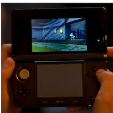
Bild 2: Sponsor Nintendo brachte zehn Test-Geräte mit, die von den Technik-Nerds auf Herz und Nieren getestet wurden.