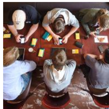
Bild 3: App-Speed-Dating: Zeige Deinem Gegenüber Deine Lieblings-App, beim Gongschlag wechselt der App-Partner.